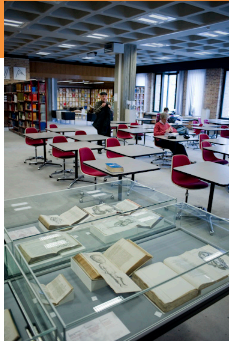
(Locatie: Openbare Bibliotheek Brugge)