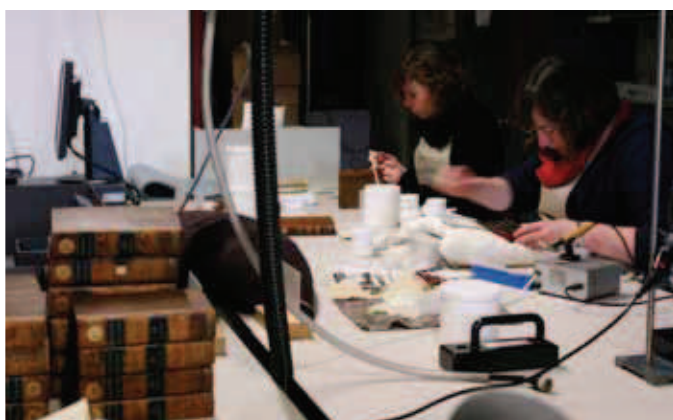
Foto's boven: Overzicht van de werktafels, van links naar rechts: droogreinen, schaderegistratie, reparatie van de boekbanden en papierrestauratie.