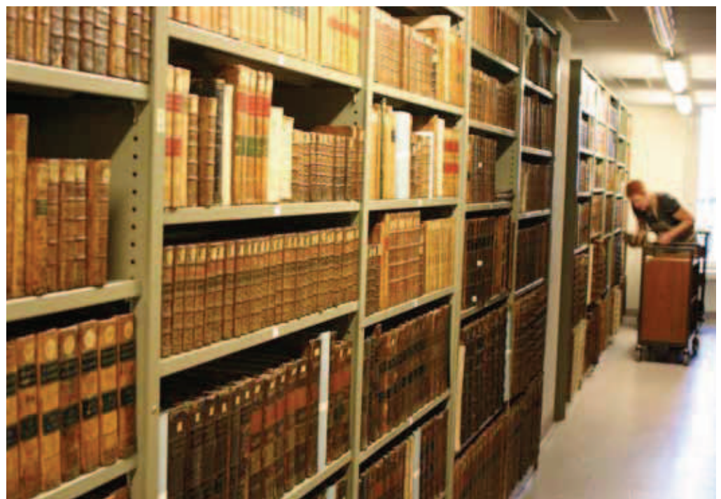
De kasten met de behandelde oude drukken in de boekenkluis van de hoofdbibliotheek Biekorf (Openbare Bibliotheek Brugge).

Deze wisselende samenstellingen waren flexibel en collega's sprongen elkaar bij wanneer er boeken voor een