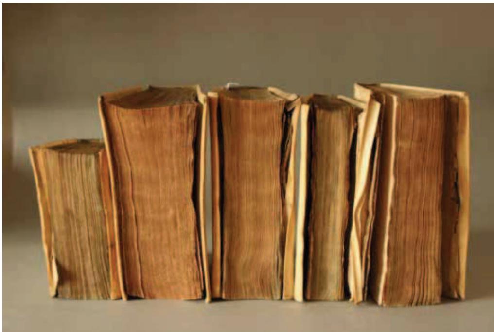
Perkamenten banden in de rij, wachtend op conservering.

onderdeel te lang 'in de file stonden'. De inzet van veel mensen, die ieder op hun manier een steentje bijdroegen, heeft dit project tot een succes gemaakt.