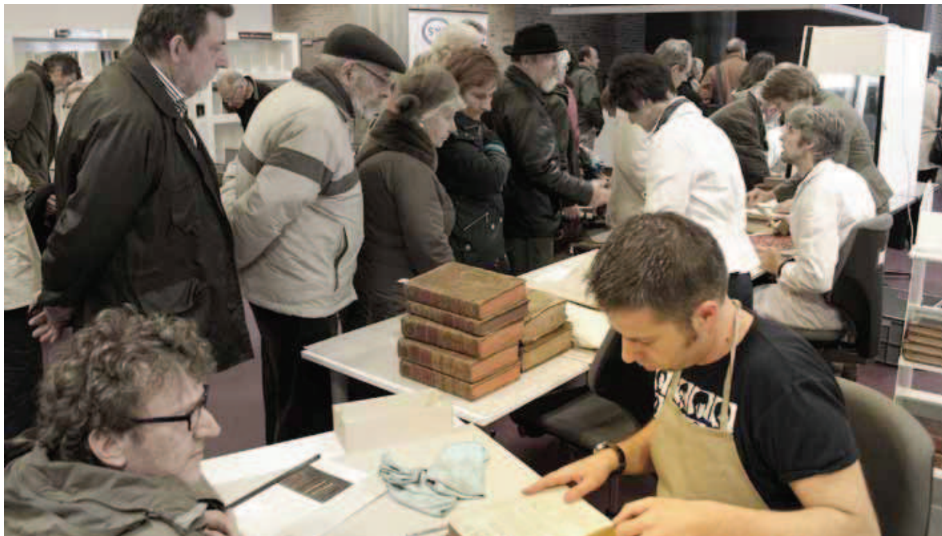
Boekendokters aan het werk: een impressie van Erfgoeddag 2012 in de Openbare Bibliotheek Brugge.

Deze alertheid geldt vaak ook voor schade aan de naaiing, de ruggengraat van een boek. In dergelijke gevallen is de schade vaak te veel werk voor de eerstelijnsconservering en volstaat het om het boek na registratie weer zijn plaats te geven op de boekenplank. Talrijke andere werkzaamheden zoals het verwijderen van schadelijke etikettes, het maken van hulzen voor losse ruggen, het vastzetten van losse delen, het vlakken van valse plooiën en het repareren van een scheurtjes kunnen allemaal wel prima uitgevoerd worden in 30 minuten.